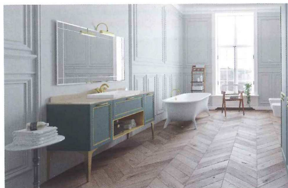
SETA design by Dario Poles

Un bagno romantico contemporaneo che si distingue per l'anta squadrata. Due le versioni, in legno, con finiture rovere tinto, rovere laccato poro aperto e rovere decapè, e in MDF laccato opaco, laccato opaco decorato con "passepartout" e laccato "secca" effetto consumato. Accessori abbinabili a seconda dello stile desiderato.