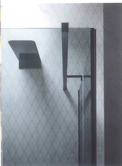
OTTO Alublack design by Stefano Spessotto

Le finiture attestano prepotentemente la loro presenza, con dettagli e soluzioni inedite, così come la ricerca di materiali all'avanguardia fa sfoggio di una ricchezza di proposte e di bellezza sempre più dominante. Un'attenzione maggiore alla sostenibilità nel progettare l'ambiente bagno che evidenzia l'estro eco-creativo dei prodotti.